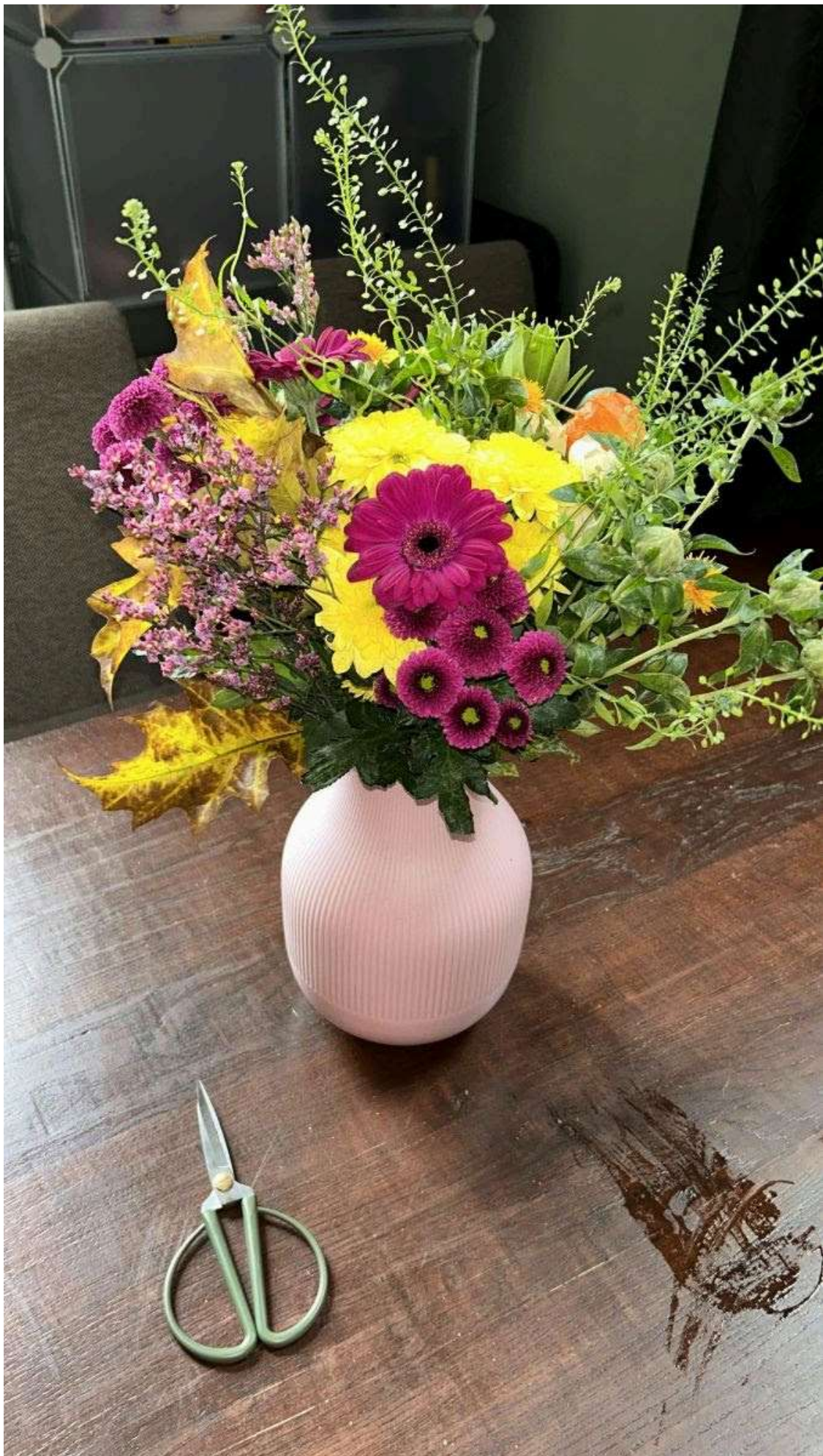
Na afloop van de wedstrijd kregen Pascale, Annefleur en Daniëlle namens het bestuur een prachtig boeket.